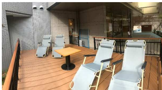
リクライニングチェア （場所はグランドとなります）