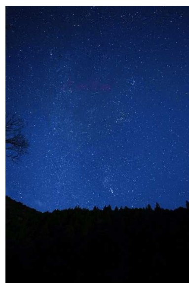
とちの木センターグラウンドから見る星空

ホテルから徒歩 8 分のところにある旧上北山小学校の「とちの木センター」。山の切り立つ上北山は空が狭いのですが、グラウンドからは空が開けて見えます。灯りの少ない上北山でふたご座流星群を鑑賞するツアーです。